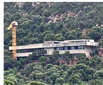
Palumbaghja, lieu-dit Forana

Au milieu de toutes ces protections, un zonage Nc du PLU approuvé sur lequel est édifée une immense bâtisse. Le permis de construire avait été refusé en 2001 par le préfet Lacroix. Il a été accordé le 10 mai 2010 par le maire et le préfet Bouillon.