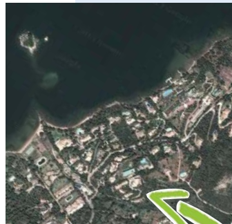
Purtivechju, Palumbaghja Sud, Bocca di l'Oru