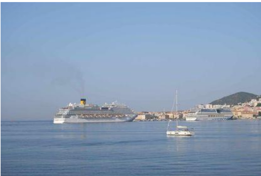
11 juillet 2023