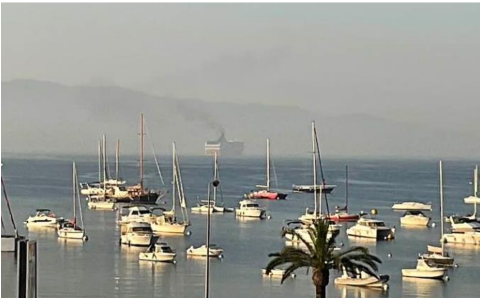
14 août 2024