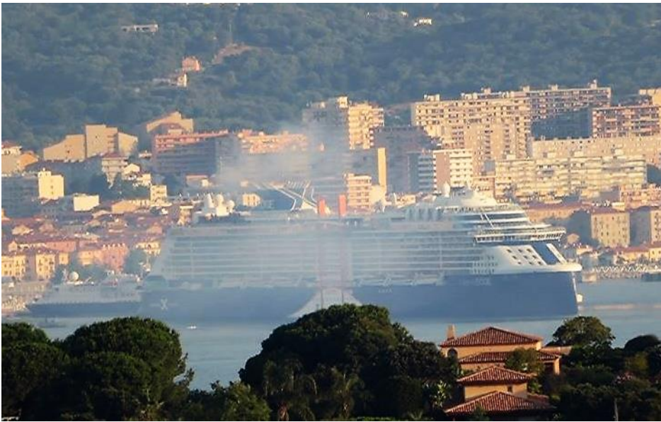
Edge 18 juin 2023