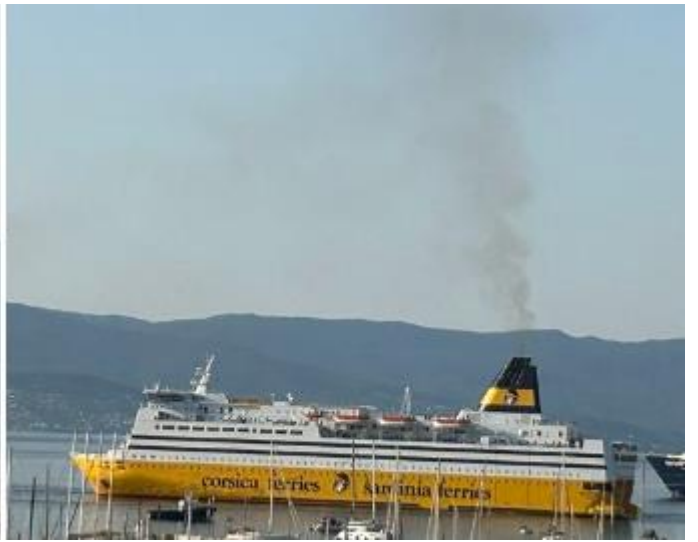
21 juillet 7h Mein Schiff et Corsica ferries