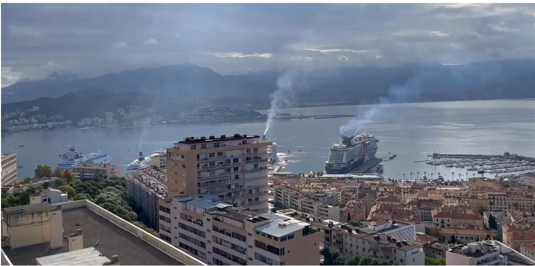
5 juin 2023