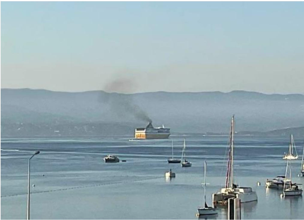
9 août – Voyager of the Seas –RCI