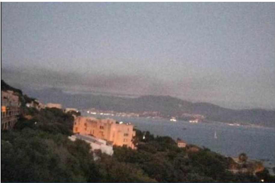
23/7 ciel ajaccien vu de Barbicaghia