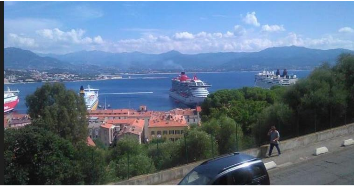
14 sept 2023